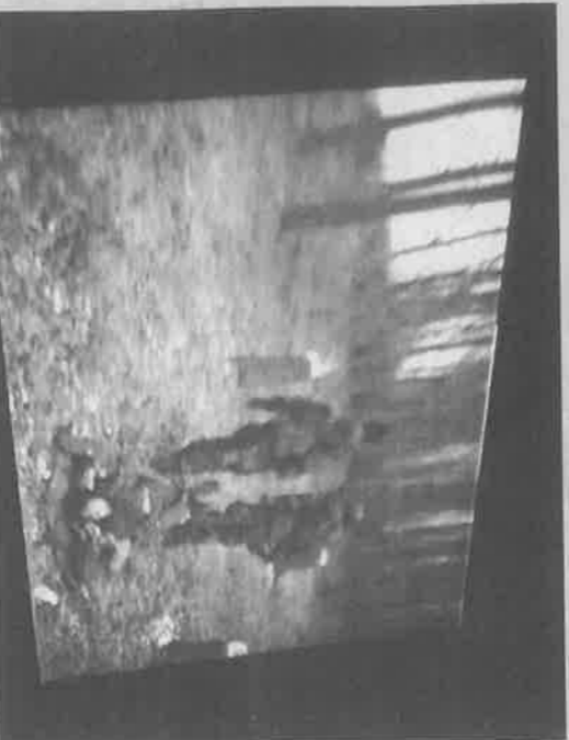
Tijela su položena na šatorska krila...