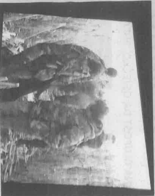
Izvlačenje tijela poginulih prema Osijeku