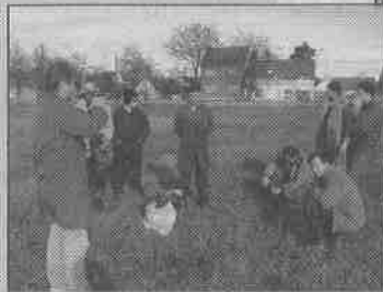
Nakon naporna posla dobro dođe hladno Osječko

pohvaliti, naglasili su ribiči. Za ovaj tjedan planirano je tampiranje petnaest centimetara zemlje, nasipavanje šljunka oko bočarskog igrališta, a nakon toga i sijanje trave, popularno zvane englezerice . Otvorenje