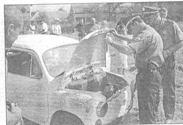
Policajci pregledavaju fiču kojega su četvorica mladića dovezla, potopila i ubrzo netragom nestala

Akciju čišćenja osiguravala su dvojica djelatnika Prve policijske postaje PU osječko-baranjske, a kada je fičo bez registracijskih oznaka izvučen iz vode uz pomoć