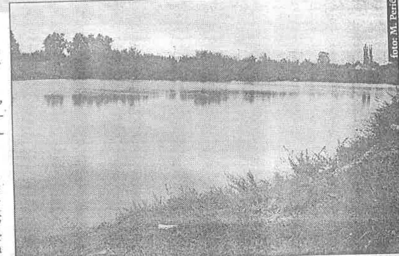
Našički je bajer donedavno bio divlje odlagalište otpada

Gradsko je poglavarstvo za uređenje bajera u 2000. odobrilo 100.000 kuna, te za 2001. još 50.000 kuna,