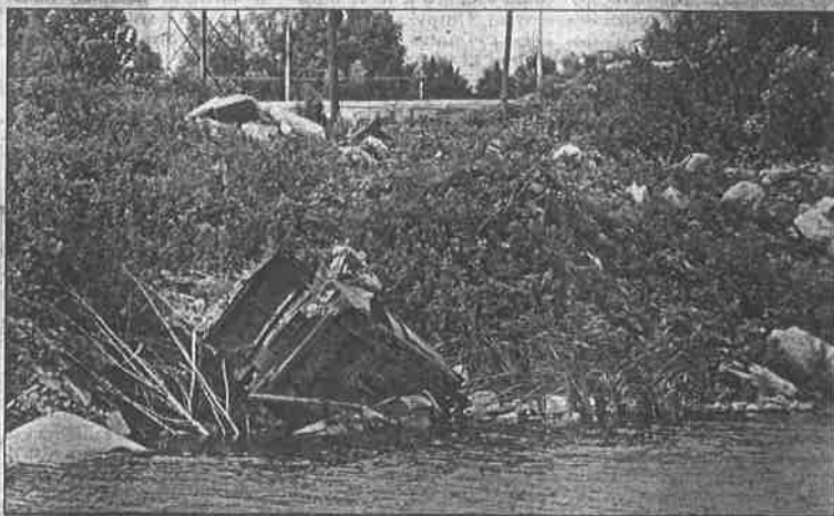
Uz raznorazni komunalni i industrijski otpad uz jezero se može naći čak i olupina automobila

Od 1998. godine na snazi je »Detaljni plan uređenja sjevero- zapadnog dijela zone skla-