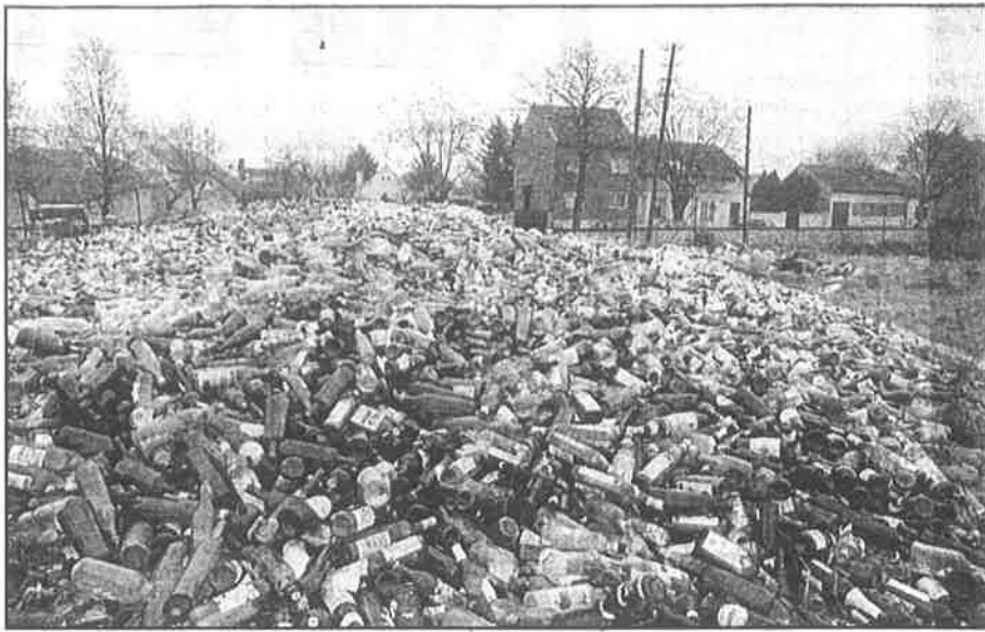
Boce u Našičkom naselju