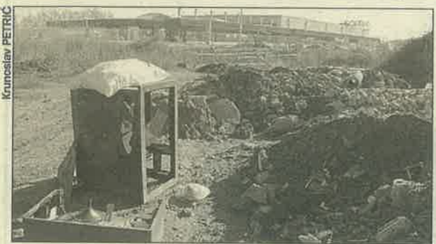
Stanari Našičkog naselja žive uz odlagalište smeća