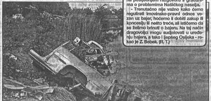
Ima tu i starih automobila