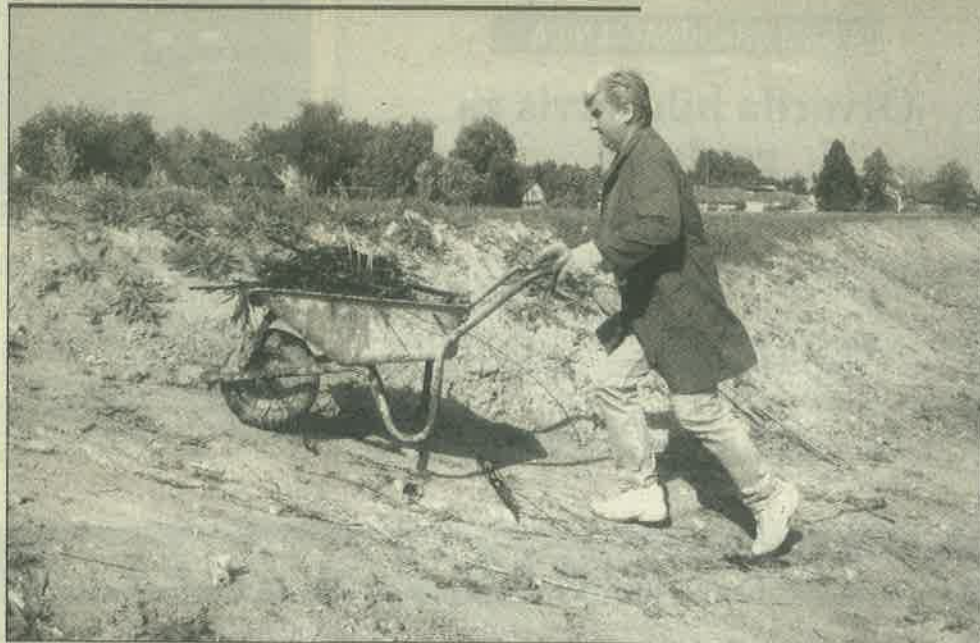
Bebek vjeruje da će se građani uspjeti izboriti za jedinstvenu sportsko-rekreacijsku zonu

Napravljeno do sada: odvezeno 2.000 četvornih metara otpada, uređeno dječje igralište, postavljena viseća kuglana za osobe s invaliditetom, napravljeno bočalište i teren za odbojku na pijesku, GČ Gornji grad osigurao je 10 novih klupa i 6 koševa za otpad, iz vode je izvađeno više od 500 četvornih metara mulja, provedene su kanalizacija, voda i struja itd. Sljedeći betoniranje ribičke staze s pristupom za invalide u kolicima.