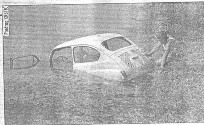
Fičo je zakvačen za sajlu i čišćenje je moglo početi

ogranka redovito uređuju travnatu površinu i bajer održavaju urednim, ovo čišćenje ne bi pobudilo osobitu pozornost da prije dva tjedna u vodi nije potopljen fičo. Ovaj neugodni prizor uznemirio je dragovoljce, pa su odmah alarmirali stanare obližnjeg Našičkog naselja, ispitujući tko je krntijom zagadio ribičku oazu.