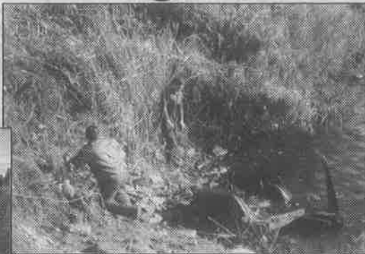
U bajeru je bilo mnogo drloga

rekreacijskoga centra "Bajer" uz Našičko naselje najavljuje se za 30. svibnja ove godine, na Dan državnosti.